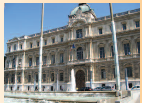
Préfecture de région

La MAP, Modernisation de l'Action Publique, s'inscrit dans la même logique que la RGPP.